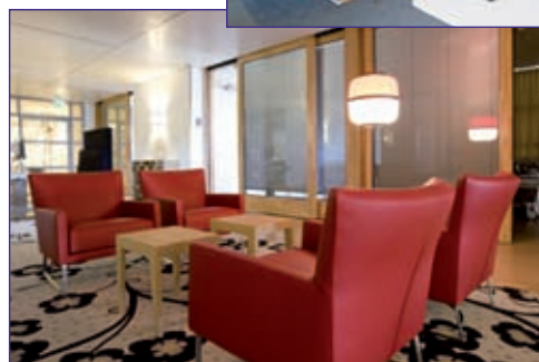
Het nieuwe ORBIS Medisch Centrum.